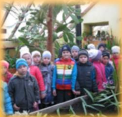
Станция юных натуралистов

Общение с природой способствует развитию у детей внимательного, заботливого отношения к ней и воспитание таких качеств, как сочувствие, сострадание и сопереживание – именно этими качествами определяется патриотизм дошкольников.